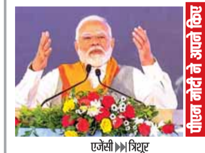
एजेसी ► त्रिशूर

'तीन शक्ति मोदीकोप्पम' सम्मेलन में बोले पीएम मोदी, इस बीच लोगों ने की फूलों की बारिश